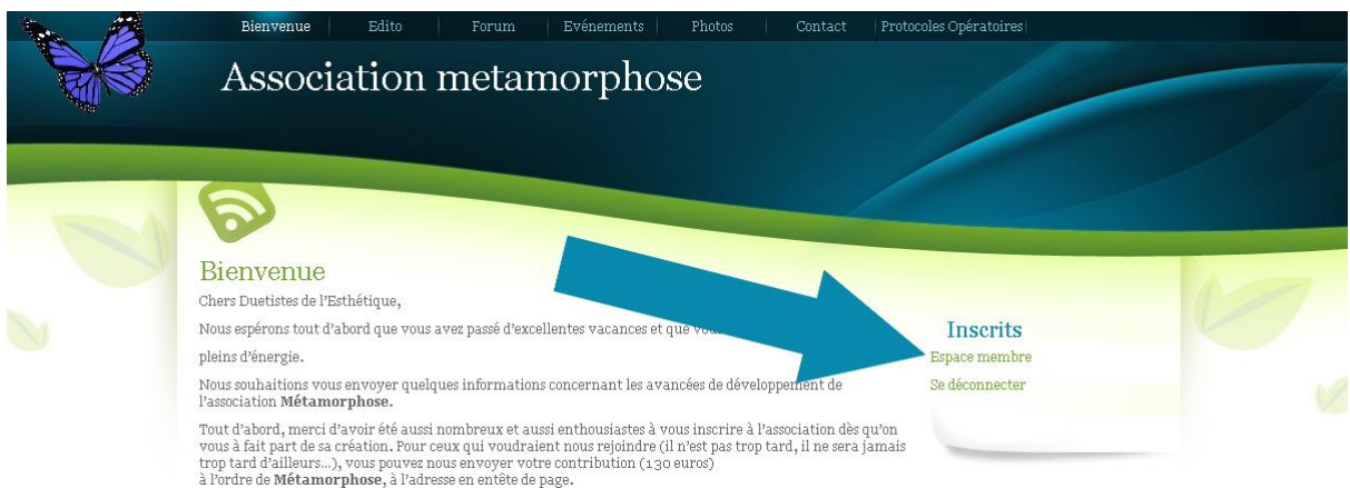
Page d'accueil de metamorphose.fr

Vous pouvez maintenant insérer, commenter les articles et accéder à l'interface d'administration en cliquant sur « Espace Membres »